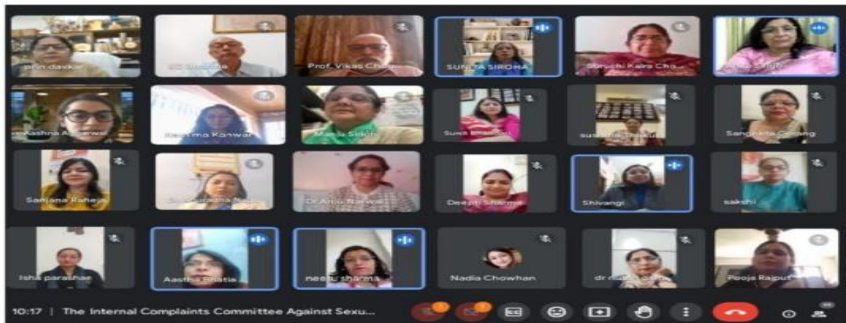
DHE approved National Seminar (Online) on “Gender Equality and Women Empowerment (SDG-5): Breaking Stereotypes of Patriarchy” March 16, 2024