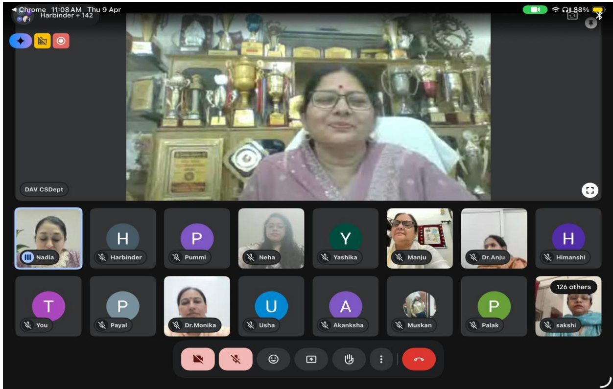
Respected Principal ma'am welcoming the resource person and attending the event