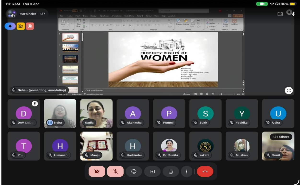
Presentation by Resource Person