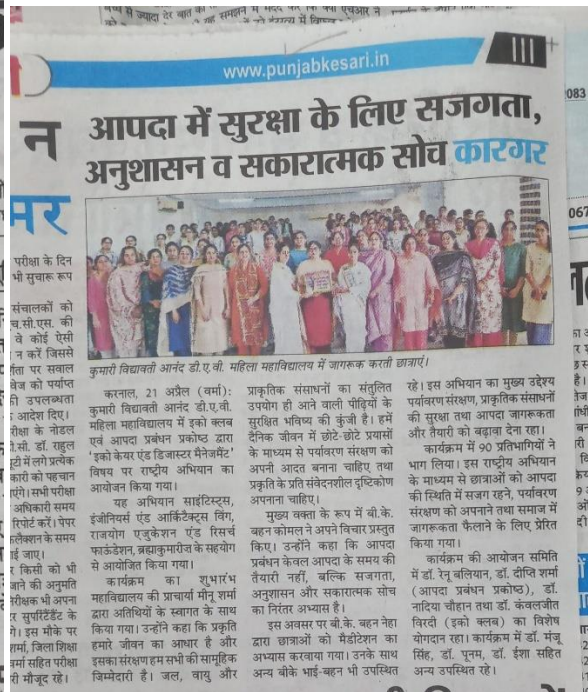
कुमारी विद्यावती आनंद डी.ए.वी. महिला महाविद्यालय में जागरूक करती छात्राएं।